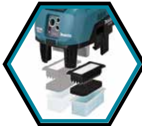
Automatisch selbstreinigende Doppelfilter.

Optionaler Wasserfilter zum Aufsaugen von Flüssigkeit.