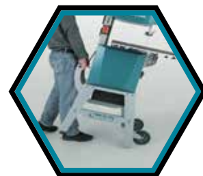
Grosse Räder, um die Maschine zu bewegen.