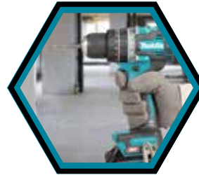
Kompaktes und leichtes Design