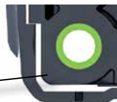
Struktur zur Stossdämpfung